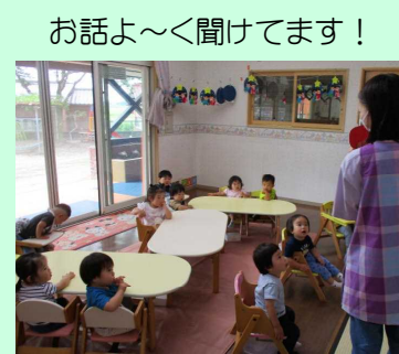
お話よ〜聞いてます！