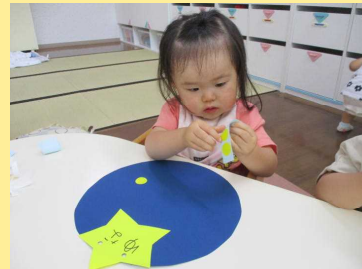
台紙から一生懸命剥がします