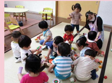
みんなでおままごと♪