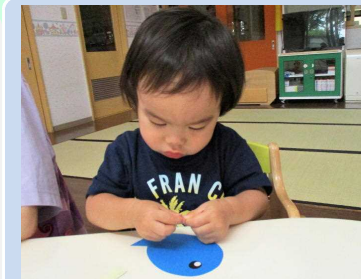
お魚作り真剣です！！