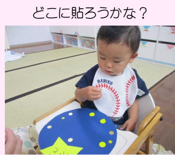
どこに貼ろうかな？