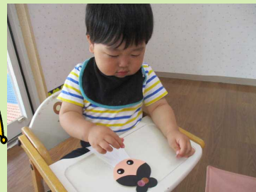
織姫をつかったよ！