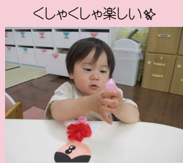
くしゃくしゃ楽しい☆