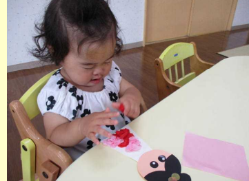
お花紙をくしゃくしゃ