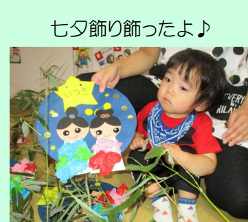
七夕飾り飾ったよ♪