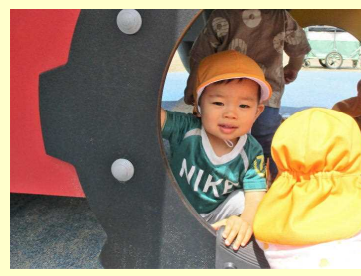
遊具の中からはあ！！