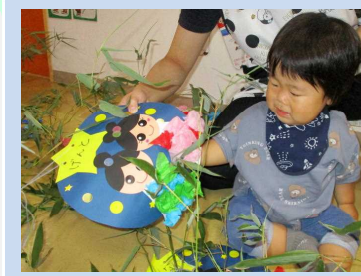
大きな竹にびっくり☆